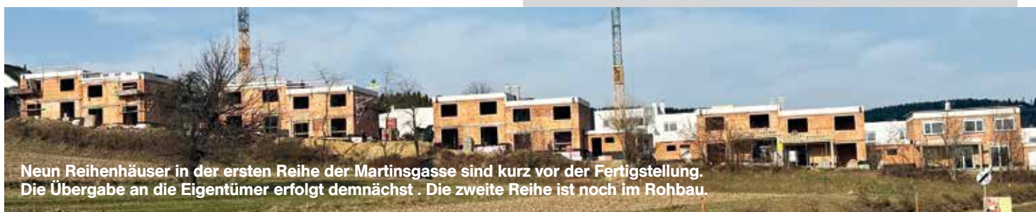
Neun Reihenhäuser in der ersten Reihe der Martinsgasse sind kurz vor der Fertigstellung. Die Übergabe an die Eigentümer erfolgt demnächst. Die zweite Reihe ist noch im Rohbau.