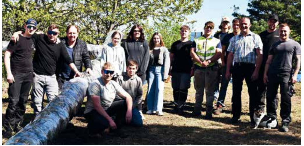
Mit vereinten Kräften stellt die Wiesener Jugend alljährlich das Osterkreuz auf

Die Wiesener Jugend ist äußerst aktiv und veranstaltet jedes Jahr mehrere „Jugend-Highlights“, wie zum Beispiel das Osterkreuz, das Maibaumaufstellen und die Muttertagsaktion und vieles mehr. Auch im heurigen Jahr wird das Osterkreuz am Karsamstag nach der Auferstehungsfeier wieder entzündet und der Maibaum am Veranstaltungsplatz oberhalb der Volksschule aufgestellt. Die Marktgemeinde Wiesen unterstützt die Wiesener Jugendlichen mit zahlreichen Förderungen, wie dem kostenlosen Erste-Hilfe-Kurs, dem Semesterticket für Studierende sowie mit Ermäßigungen für Musikveranstaltungen am Festivalgelände.