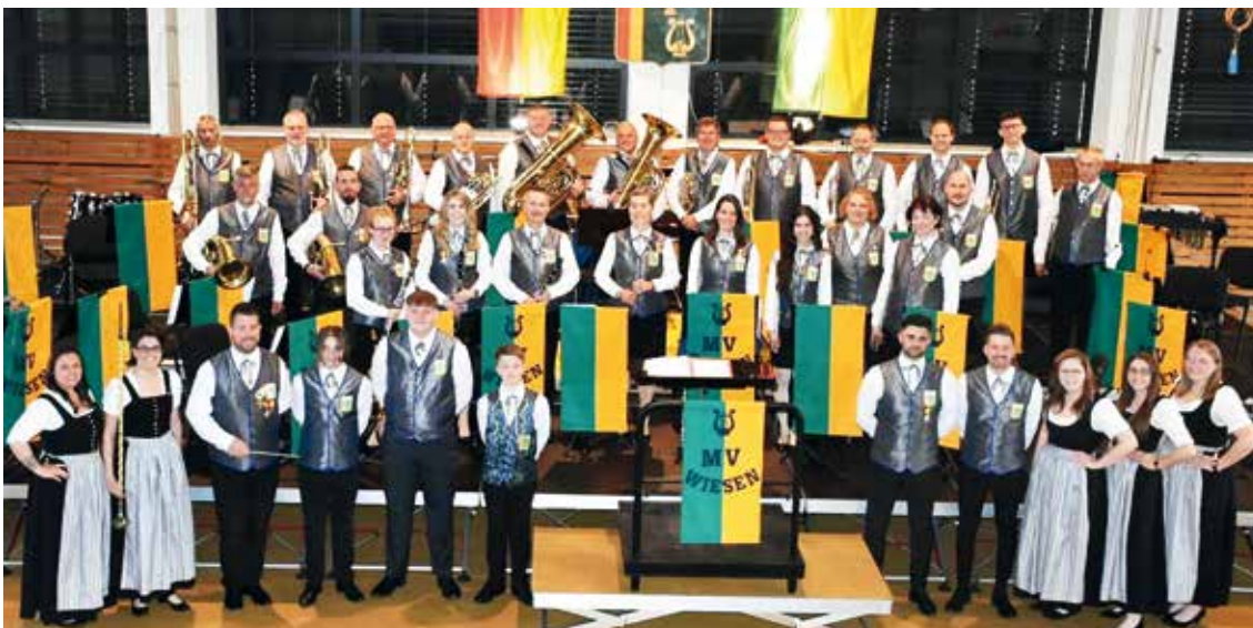
Der Musikverein Wiesen ist einer der wichtigsten und aktivsten Kulturträger in der Gemeinde. Im Bild links bei einem der traditionellen Frühjahrskonzerte

Die tragenden Vereine sind in öffentlichen Gebäuden der Marktgemeinde Wiesen untergebracht, bezahlen keine Mietkosten und teilweise auch keine Strom- und Heizkosten.