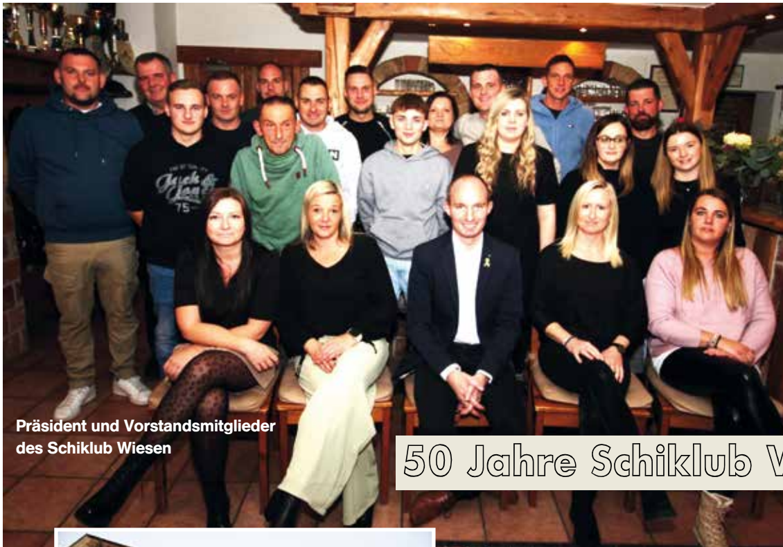
Präsident und Vorstandsmitglieder des Schiklub Wiesen