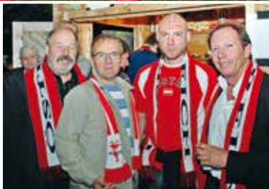
EURO-Fußball- meisterschaft 2008: Präsident Josef Ban (I)