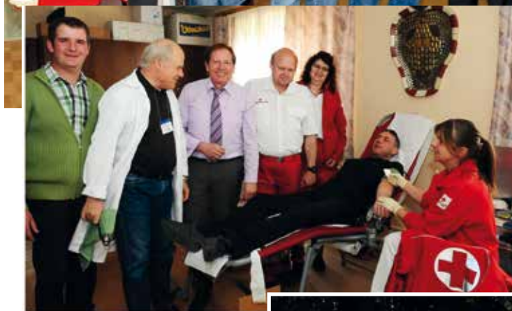
Blutspenden 2009 (o)