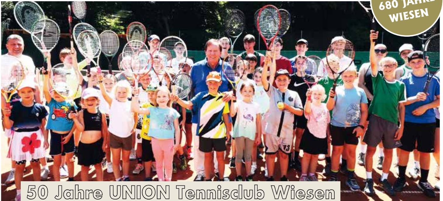
50 Jahre UNION Tennisclub Wiesen

2025: Tenniscamp für Kinder und Jugendliche (o) Herrenmannschaft (r) Damenmannschaft (ganz rechts)