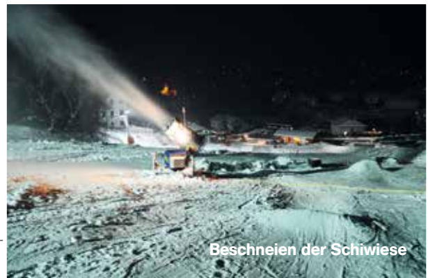
Beschneien der Schiwiese