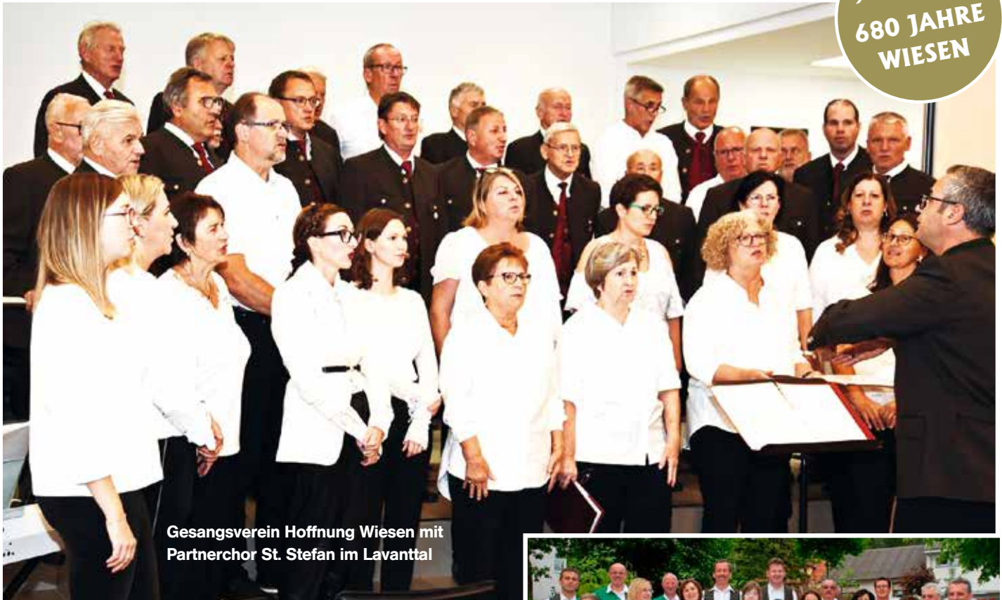
Gesangsverein Hoffnung Wiesen mit Partnerchor St. Stefan im Lavanttal