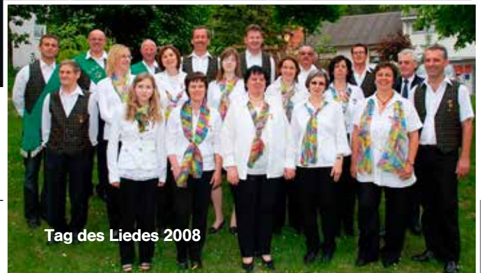
Tag des Liedes 2008