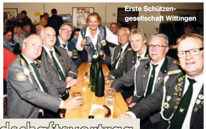
Erste Schützen- gesellschaft Wittingen