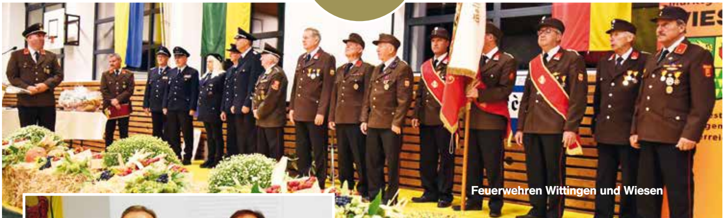
Feuerwehren Wittingen und Wiesen