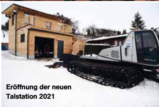
Eröffnung der neuen Talstation 2021