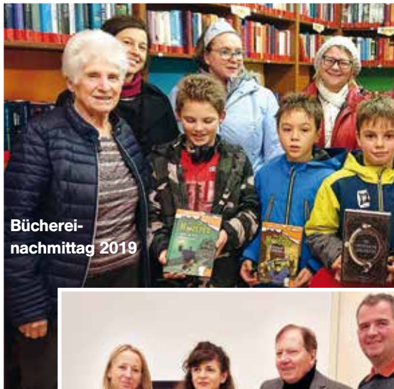
Bücherei- nachmittag 2019