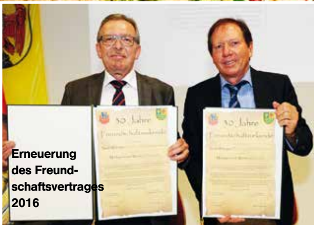
Erneuerung des Freundschaftsvertrages 2016