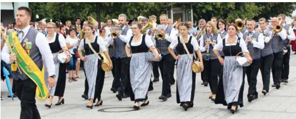
Der Musikverein Wiesen bei einem der zahlreichen Auftritte

Das neue Einsatzfahrzeug UNIMOG Logistikfahrzeug wurde bereits im Jahre 2024 bezahlt.