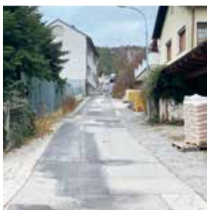
Waldgasse wird neu asphaltiert

Bereits im Jahr 2022 bezahlte die Marktgemeinde Wiesen EUR 500.000,- vorzeitig zurück. Nun wird der aushaffende Betrag in der Höhe von EUR 233.000,- vorzeitig zurückbezahlt. Das Feuerwehrhaus ist somit acht Jahre vor Endfälligkeit abbezahlt und der Infrastrukturverein schuldenfrei.