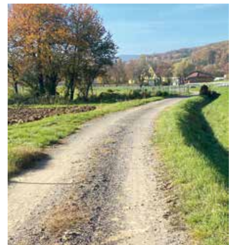
Ein neuer Radweg soll entstehen