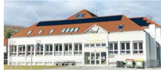
Bild oben: Photovoltaikanlage auf dem Volksschuldach links: Die Wiesener Jugend stets aktiv