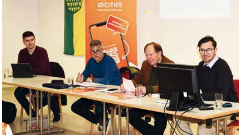
Wiesen geht digital – mit dieser Schlagzeile wurde die neue Cities App der Wiesener Bevölkerung im Mai vorgestellt

Vier digitale Schultafeln, sogenannte „Smartboards“, wurden für die Volksschulkinder und Pädagoginnen angeschafft um das Lernen zu vereinfachen. Diese „Smartboards“ ermöglichen es, über angeschlossene Laptops Inhalte auf der Tafel anzuzeigen