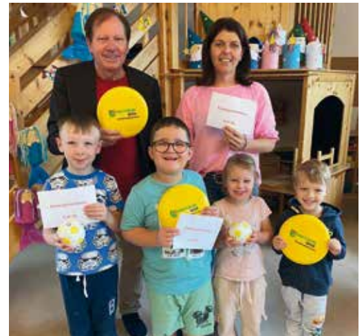
Kindergartenbonus und Schulstartgeld für jedes Kind. Alle Wiesener Kindergarten- und Volksschulkinder erhielten von der Marktgemeinde Wiesen einen Kindergartenbonus bzw. ein Schulstartgeld

Der Funcourt für die Jugendlichen wurde generalsaniert und mit einem Turnier eröffnet. Als Höhepunkt fand ein „Show-Match“ zwischen den Pfarrgemeinderäten (Don Camillo) und den Gemeinderäten (Peppone) statt