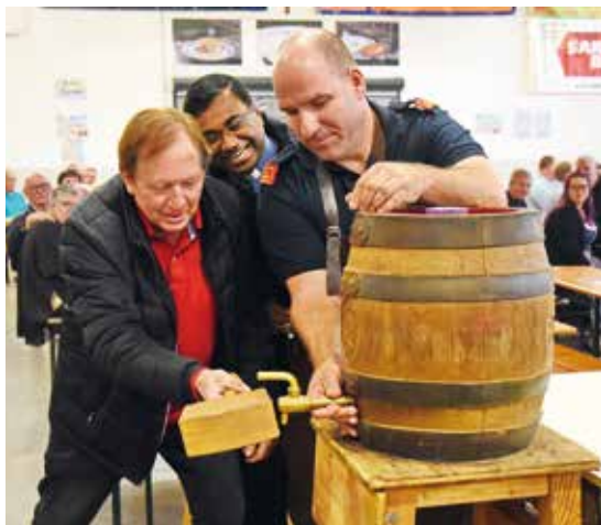
Tadelloser Bieranstich mit vereinten Kräften