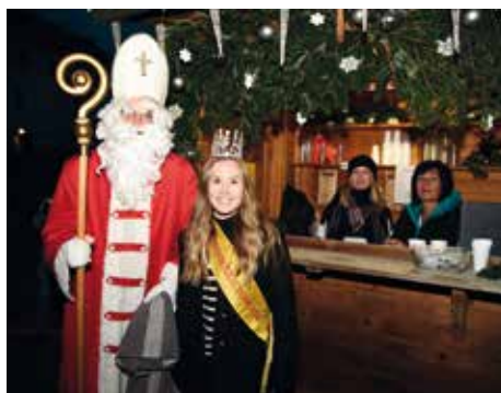
Schiclub bot köstlichen Apfelkuchenlikör