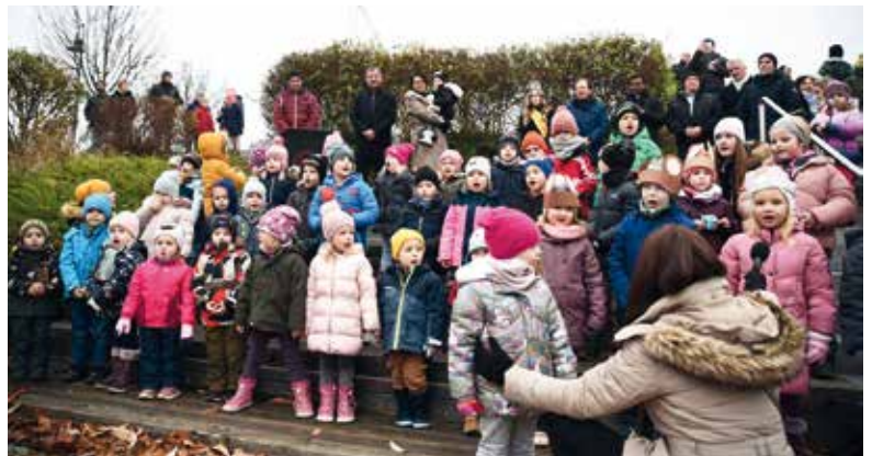
Kindergartenkinder trugen vorweihnachtliche Lieder und Gedichte vor