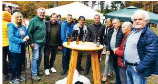
Treffen am Aussichtsturm mit Bgm. Bernhard Karnthaler und den Wanderern aus Lanzenkirchen

Der Aussichtsturm wurde in einem gemeinsamen Projekt errichtet und seit der Eröffnung im Herbst 2019 von über 25.000 Wanderern besucht. Der Ausklang der Wanderung fand in der Waldschenke statt.