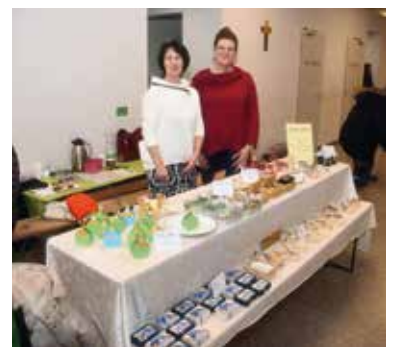
Verkaufsstand für Afrika