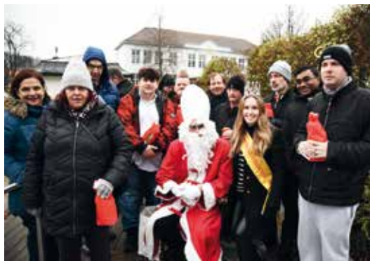
Bewohner der Betreuungseinrichtung „pro mente“ Burgenland besuchten die Nikolausfeier und wurden auch beschenkt (li)