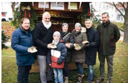
Mehlspeisen beim Stand des Elternvereins