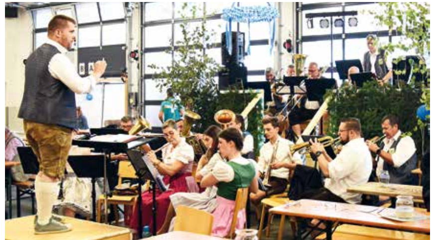
Der Musikverein Wiesen sorgte in bewährter Manier für zünftige Unternehmung