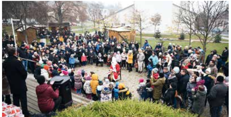
Viele Kinder und Erwachsene sind zur Nikolausfeier gekommen