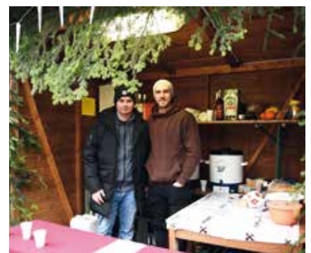
Weihnachtsstand des SC Wiesen