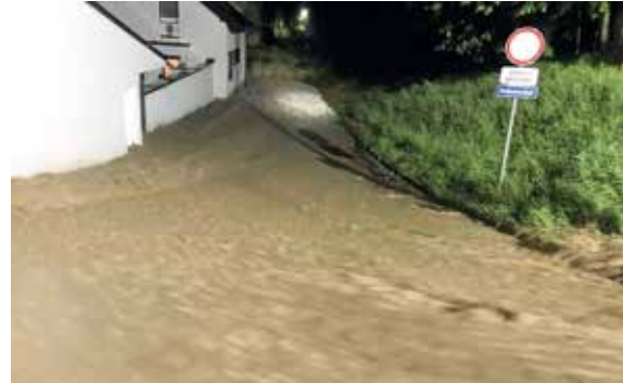
Hochwasser nach Unwetter - Schutz wird erhöht

Nachhaltiger Schutz der Ortschaft, des Festivalgeländes und des Gewerbeparks. Rückhaltedämme und der Ausbau des Bachbettverlaufes in der Bahnstraße und in der Schöllingstraße sollen die Ortschaft, das Festivalgelände und den Gewerbepark vor Überschwemmungen schützen. Die voraussichtlichen Kosten betragen rund fünf Millionen Euro.