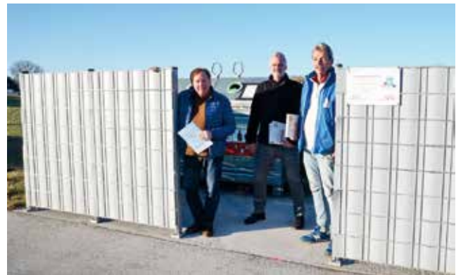
Sichtschutz für Müllsammelstelle an der Kreuzung Keltenstraße - Mitterweg