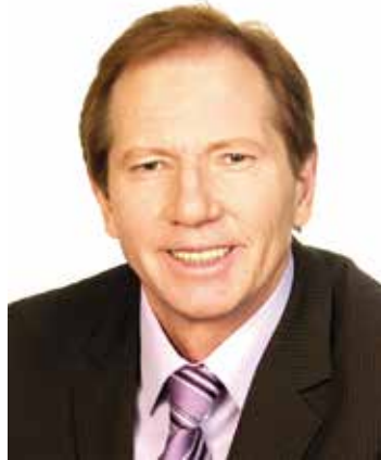
Bürgermeister MATTHIAS WEGHOFER

- Installierung klimafreundlicher Photovoltaikanlagen auf öffentlichen Gebäuden. - Planung und Ausbau des Edlesbaches im Bereich der Bahnstraße zum Schutz vor Überschwemmungen. - Schutz des Festivalgeländes und des Gewerbegebietes in der Schöllingstraße vor Überschwemmungen. - Neuer Rastplatz bei der Kreuzung Mitterweg/Keltenstraße im Ortsteil bei Bad Sauerbrunn.