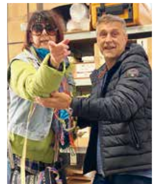
Ein Tänzchen in Ehren des Vizebürgermeisters