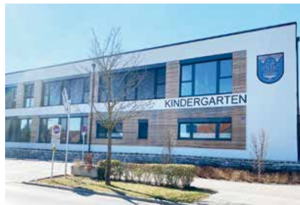
Die Marktgemeinde zahlt 174.916 Euro an die Gemeinde Bad Sauerbrunn für Kindergarten- und Schulbesuch