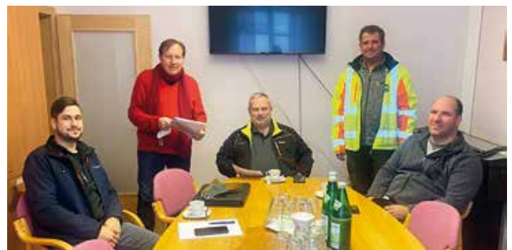
Funktechnik Klein stellte Notstromaggregat vor

Für 30 aktive Feuerwehrkameraden wird bzw. wurde bereits eine neue Schutzbekleidung für Feuerwehreinsätze angekauft. Die neue Schutzbekleidung soll die Feuerwehrkameraden bei oft extremen Einsätzen schützen und vor gesundheitlichen Schäden bewahren.