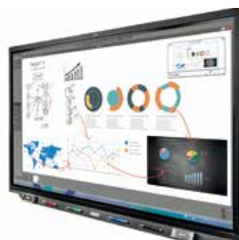
Digitalisierung in der Volksschule - zwei Smartboards

Mit der Anschaffung von neuen Smartboards wird die Digitalisierung an der Volksschule Wiesen fortgesetzt. Die Digitalisierung der Tafel verspricht neue Möglichkeiten für die Pädagogen und Schulkinder und eine zukunftssichere Infrastruktur. In den letzten Jahren wurden die Volksschulklassen mit neuen Laptops ausgestattet.