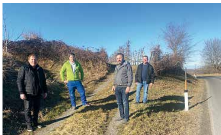
Besichtigung des neuen Radfahrweges nach Bad Sauerbrunn